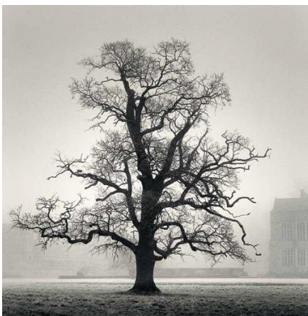
Graceful Oak, Broughton, Oxfordshire, England, 2005