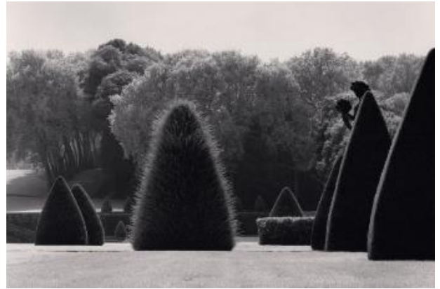
Unclipped Bush, Vaux-le-Vicomte, France, 1999