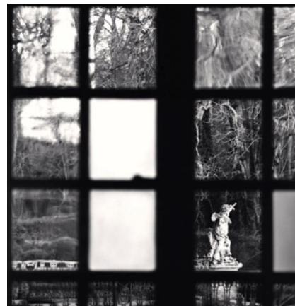
Window View, Château de Haroué, Lorraine, France, 2013