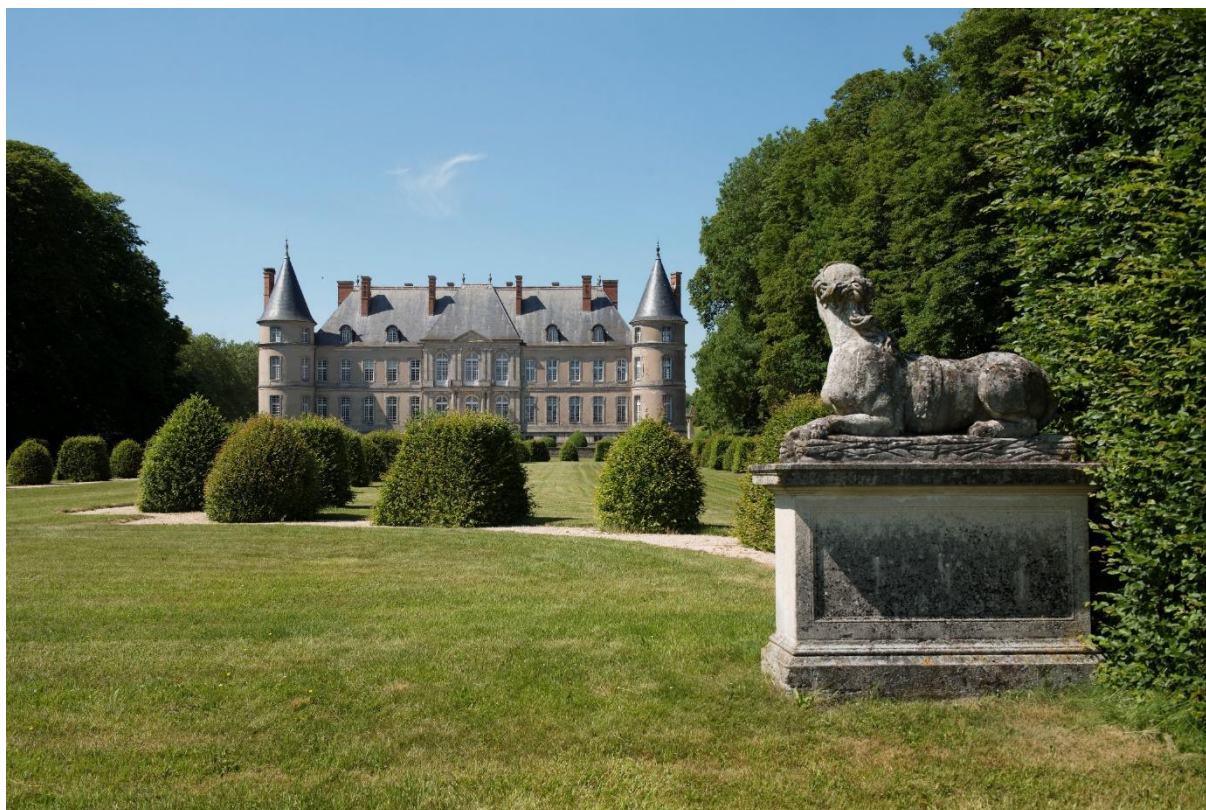
Château de Haroué, façade sud sur jardin

Le prince Marc de Beauvau-Craon prit possession des terres de Haroué en 1720 et fit immédiatement appel à l'architecte Germain Boffrand pour reconstruire le château médiéval réaménagé pour les Bassompierre à la fin du XVI e siècle. Boffrand avait travaillé sur des chantiers royaux avant de se tourner vers des clients privés, parmi lesquels le duc de Lorraine, Léopold I er , dont Marc de Beauvau était le grand écuyer. A Haroué, Boffrand conserva les douves du château médiéval et s'adapta à sa structure avec quatre tours cantonnant un corps de logis principal et deux ailes. Les travaux de ce chef-d'œuvre de l'architecture française du XVIII e siècle s'achevèrent en 1729. Les grilles de la cour d'honneur, ainsi que les ferronneries des balcons et de l'escalier d'honneur, ont longtemps été attribuées à Jean Lamour, auteur des grilles de la place Stanislas à Nancy. Elles sont en réalité l'œuvre du serrurier Pierre Barthélémy qui s'illustra sur le chantier de Lunéville. Les statues des jardins, dues à Barthélemy Guibal, sont en revanche un point commun indubitable avec la place Stanislas puisque Guibal fut un des principaux auxiliaires de son architecte, Emmanuel Héré.