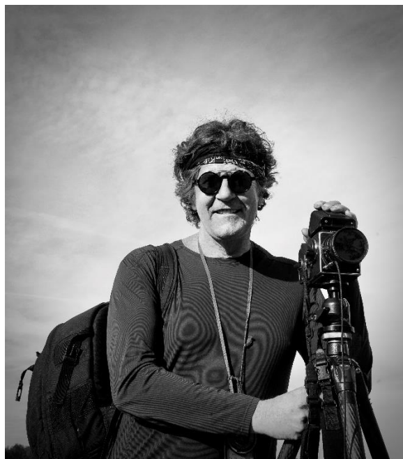
Michael Kenna © Matteo Colla 2021

Fruit d'une mûre réflexion, sa technique photographique (temps de pause longs, attention portée à la lumière, tirages extrêmement soignés), rappelle sa proximité avec la peinture et particulièrement celle dite « sur le motif » où l'on cherche, au-delà de la sublimation d'un paysage, la contemplation du temps.