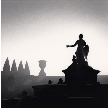
Bassin de Latone, Versailles, France, 1997