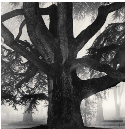
Giant Tree, Giardini Pubblici, Reggio Emilia, Italy, 2007